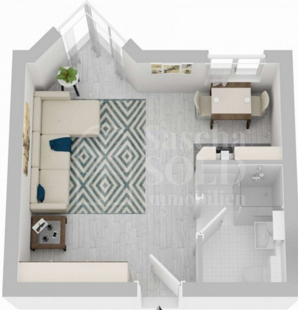
Grundriss - W26