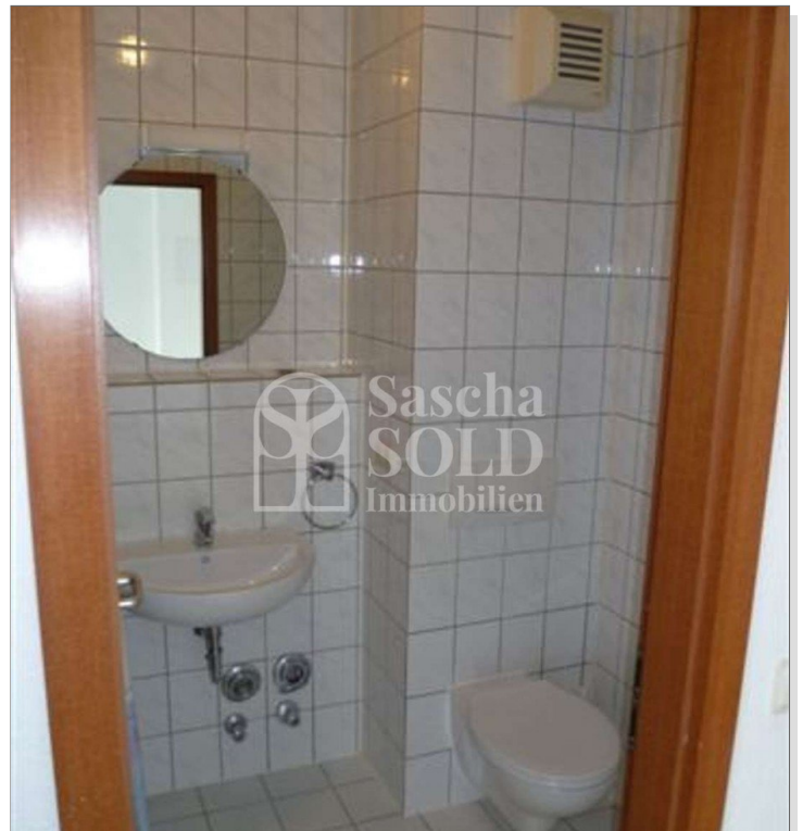
W26 - Badezimmer