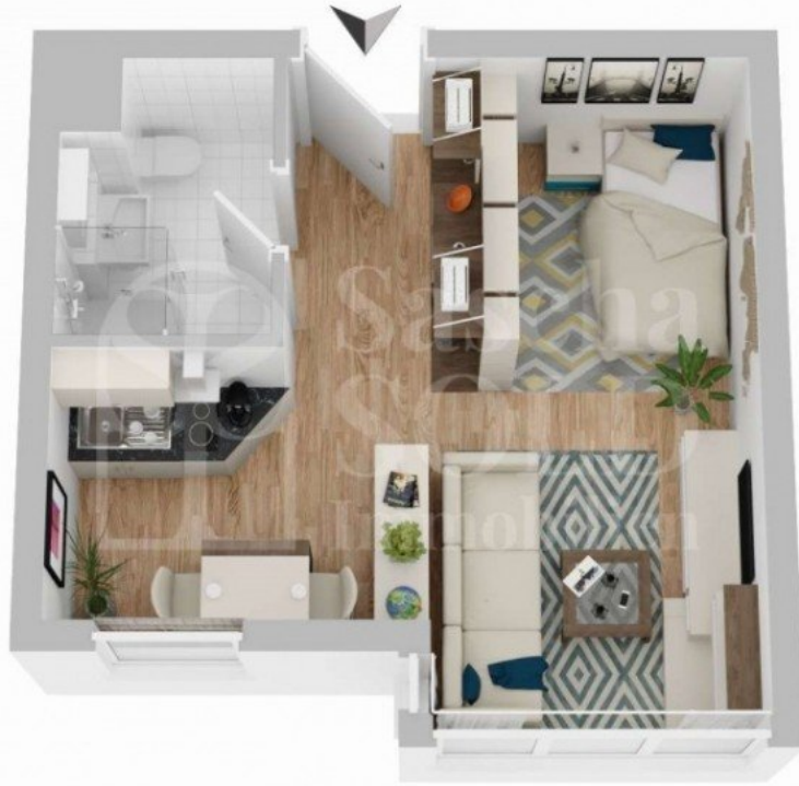
Grundriss - W14