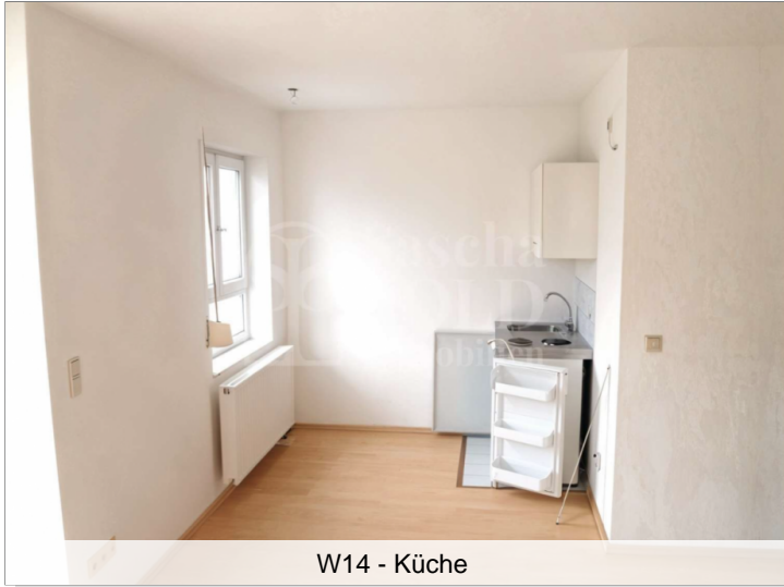
W14 - Küche