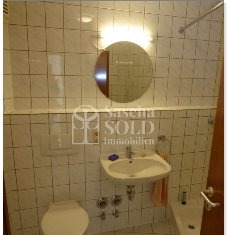
W27 - Badezimmer