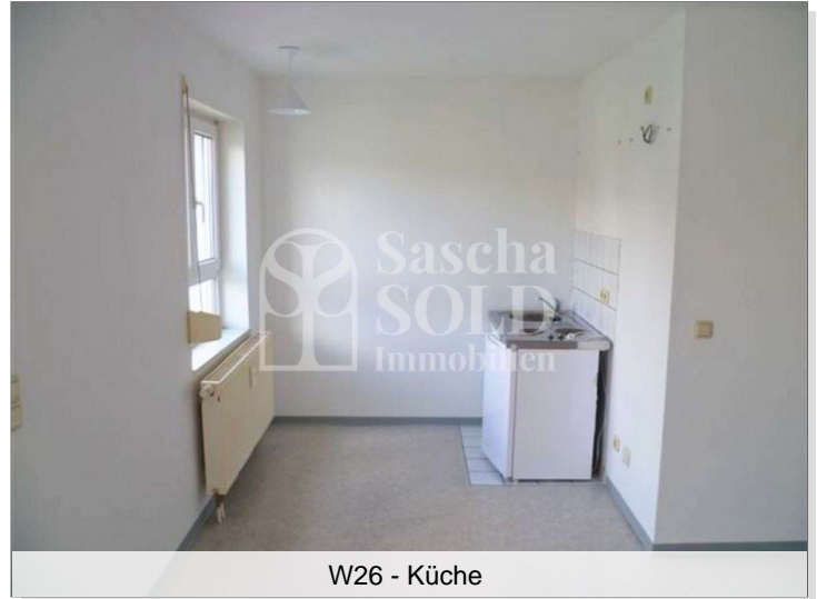
W26 - Küche