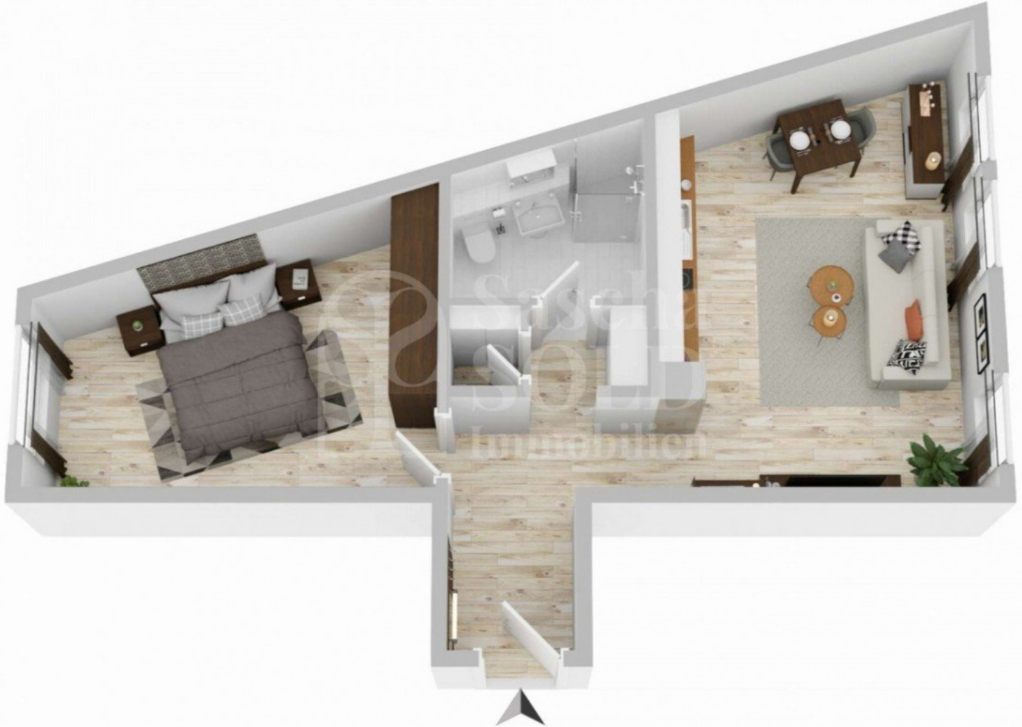
Grundriss - W18