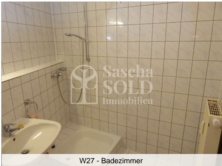
W27 - Badezimmer