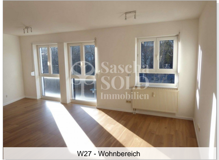
W27 - Wohnbereich