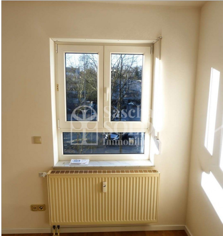
W27 - Wohnbereich