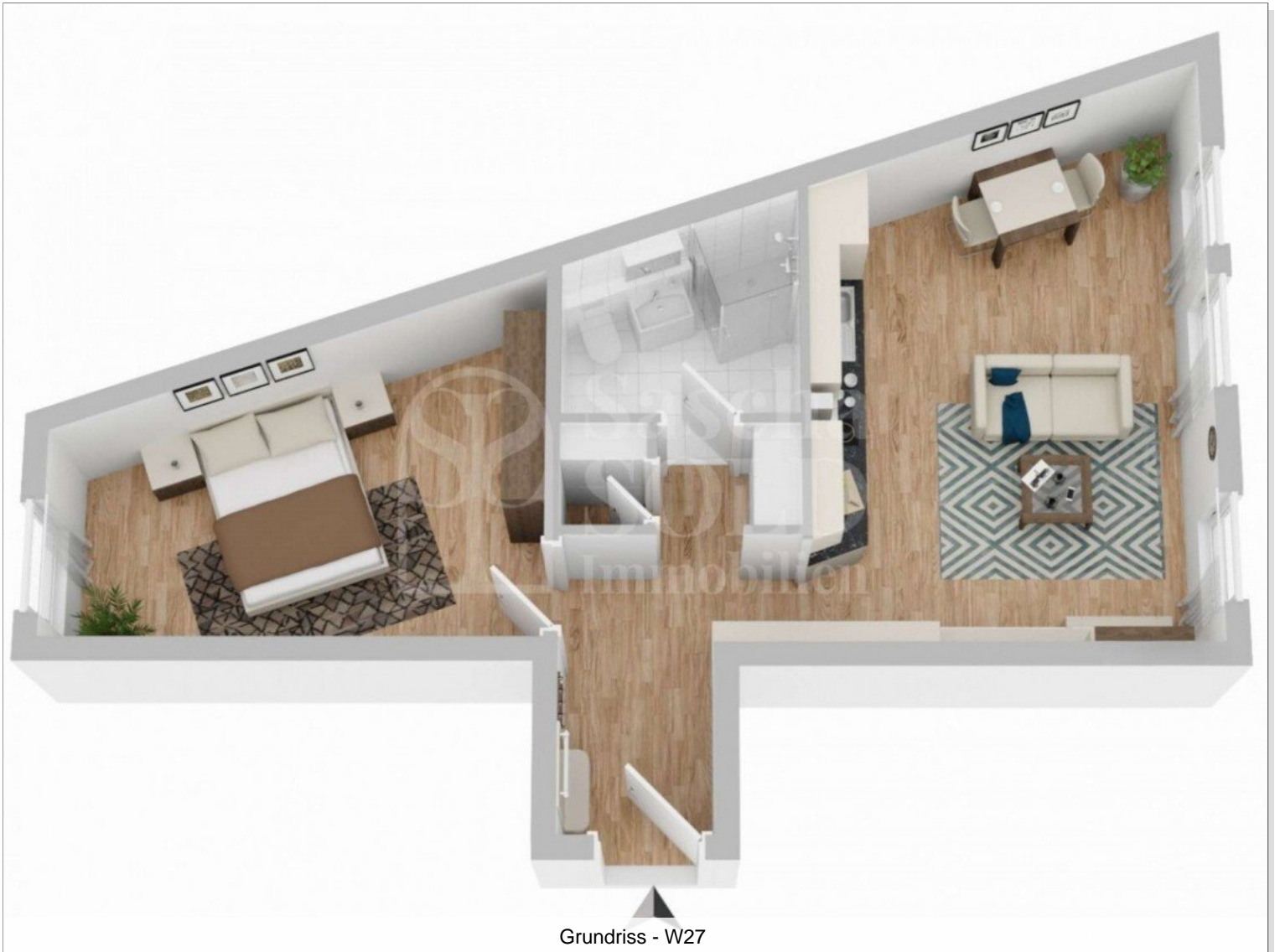
Grundriss - W27