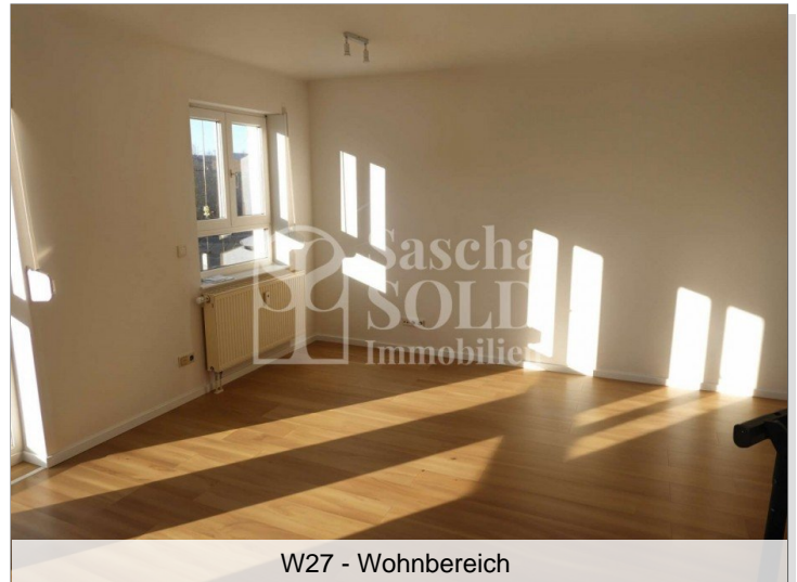
W27 - Wohnbereich