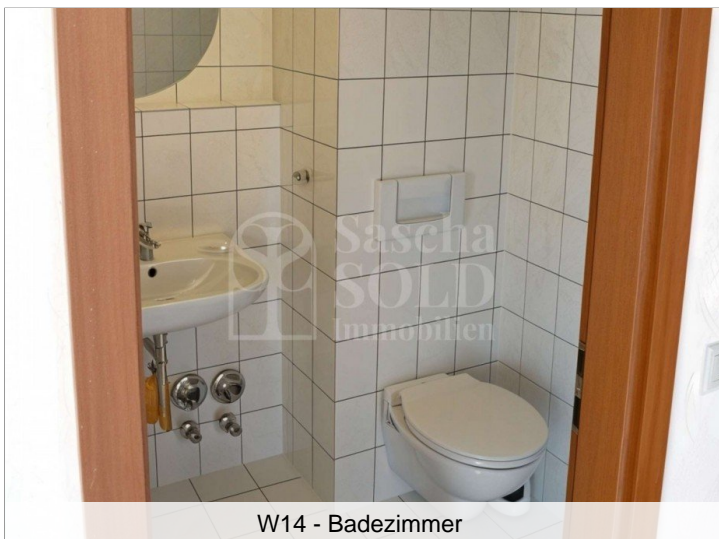
W14 - Badezimmer