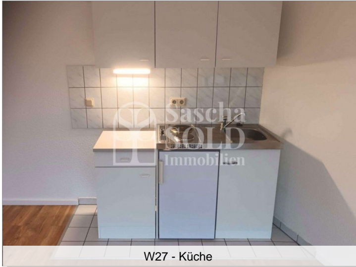
W27 - Küche