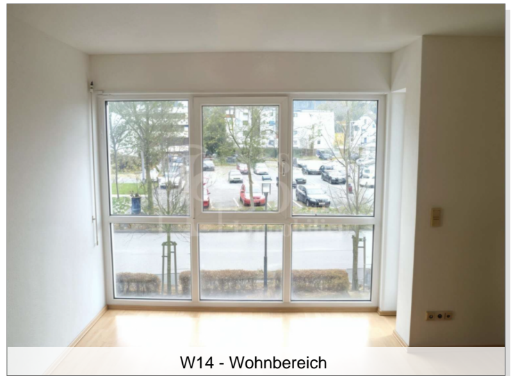
W14 - Wohnbereich