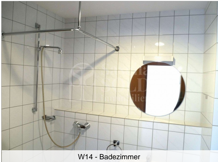
W14 - Badezimmer