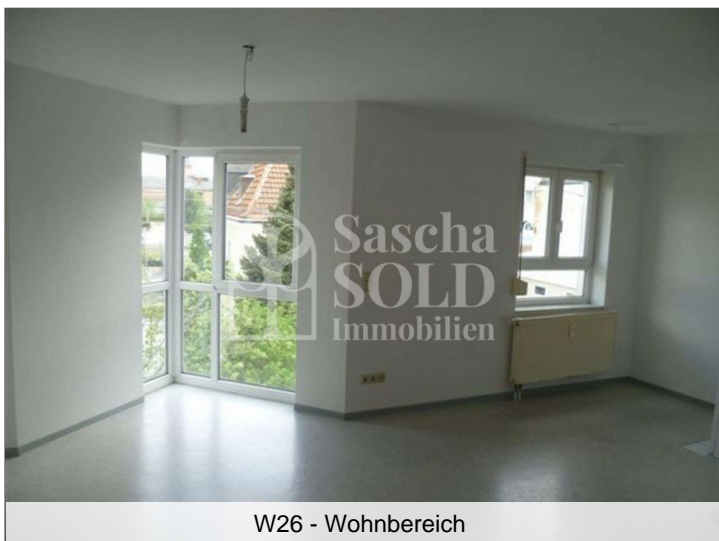
W26 - Wohnbereich