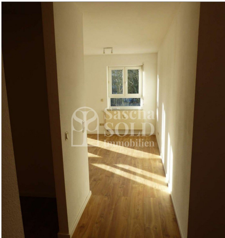
W27 - Diele