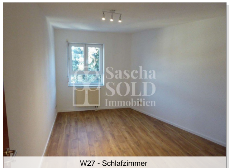
W27 - Schlafzimmer