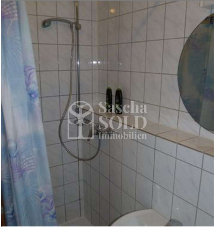
W26 - Badezimmer