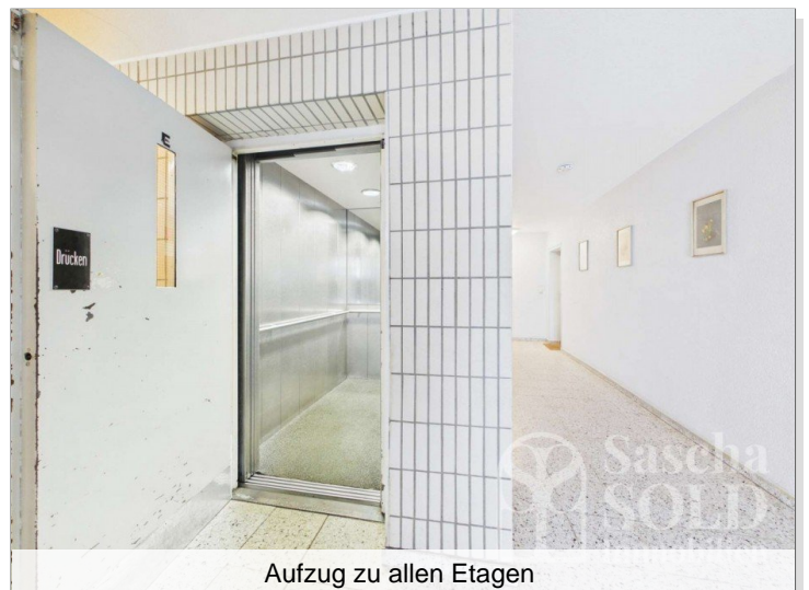
Aufzug zu allen Etagen